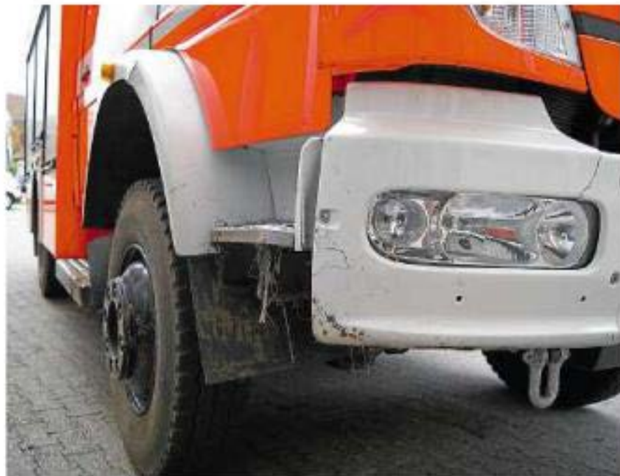
Augenscheinlich nur kleinere Schäden verursachte der Unfall bei einer Einsatzfahrt.

Um die Brandschutzsicherheit im Stadtgebiet in vollem Umfang sicherzustellen, hat die Wehrführung eine Umgruppierung vorgenommen. Das Fahrzeug aus Raestrup wird bis auf Weiteres an der Ritterstraße stationiert. Im Gegenzug wird dort in der Garage nur ein kleiner Lkw stehen.