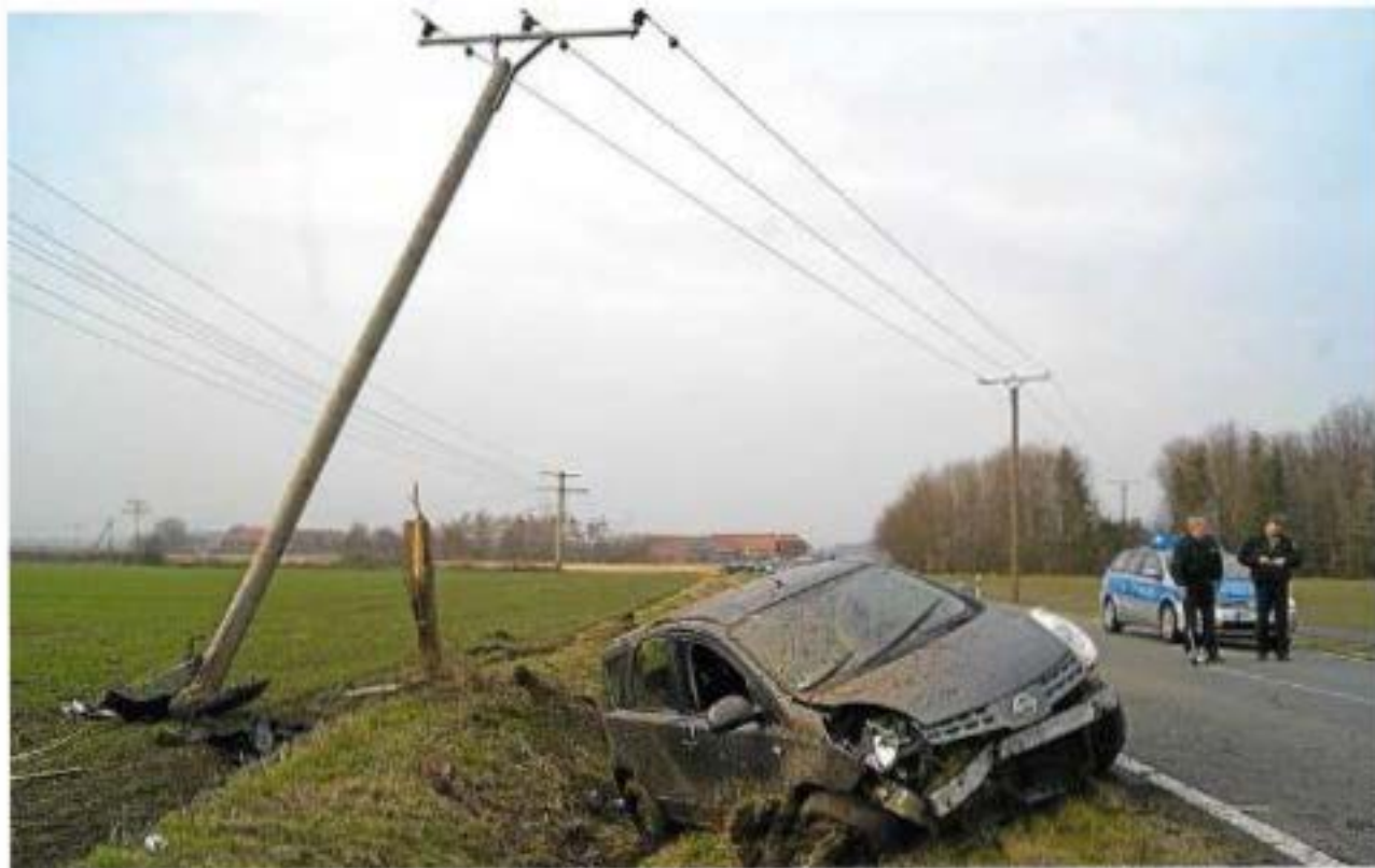
Bei einem Unfall in Höhe des Berdelflugplatzes zerbrach dieser Strommast.