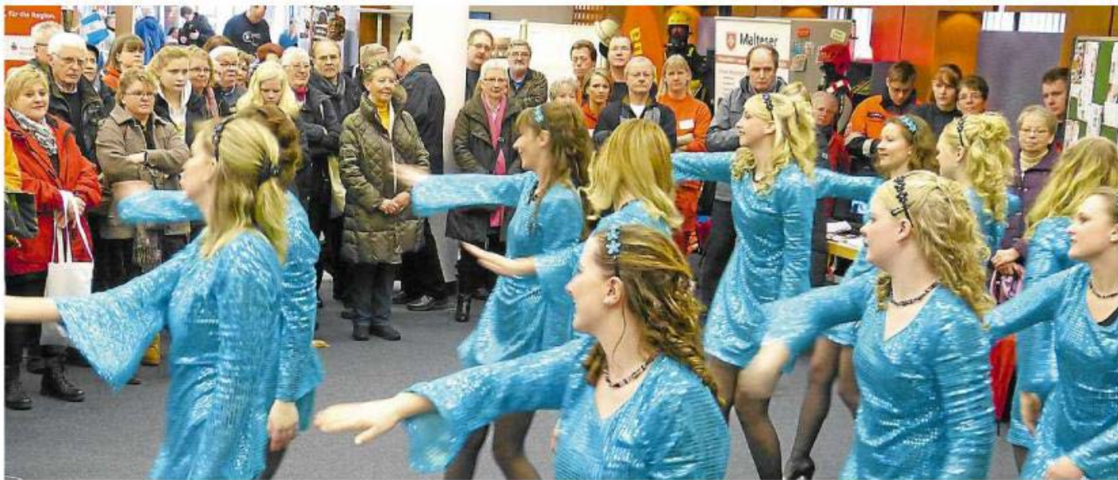
Den ganzen Tag über gab es verschiedene Vorführungen. In der Sparkasse tanzte die 1. Telgter Stadtgarde.