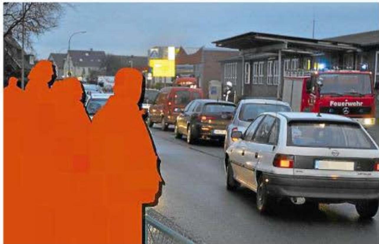
Reichlich „Zuschauer“ hatte die Feuerwehr auch bei ihrem letzten großen Einsatz beim Brand in der ehemaligen Druckerei am Baßfeld.

„Gucken an sich ist kein Straftatbestand. Und Schaulustige überschreiten Grenzen auch nur vereinzelt, so dass wir dann Maßnahmen wie Platzverweise erteilen müssen“, sagte von der Polizei Warendorf deren Pressesprecherin Dagmar Artmeier. Im Regelfall würde die Polizei Unfallstellen eh großräumig absperren und Verkehr umleiten. „Im Gegensatz zur Polizei hat die Feuerwehr allerdings keine Möglichkeit, rechtliche Schritte gegen Schaulustige einzuleiten“, so Artmeier weiter. Hier sei die enge Zusammenarbeit von Wehr und Polizei gefordert.