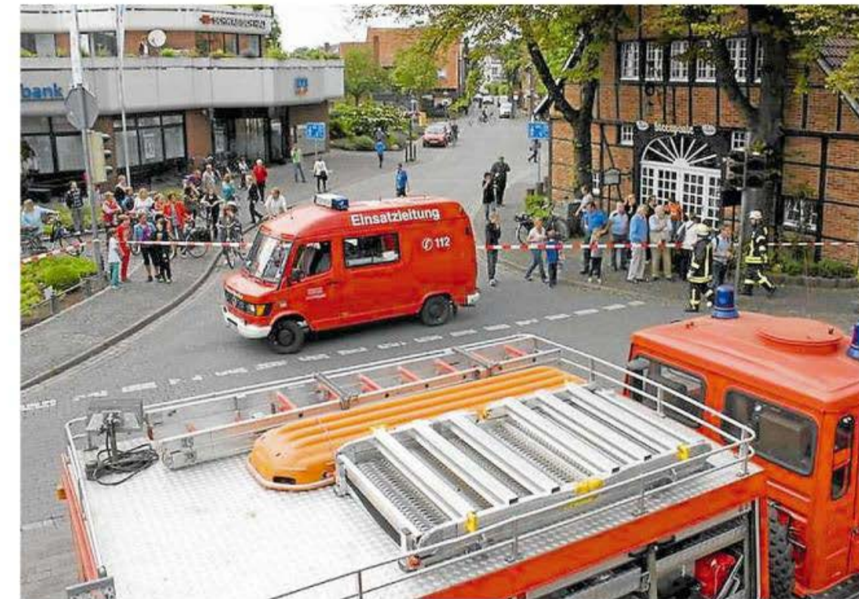
Dutzende von Menschen strömten im Juli 2012 beim Verkehrsunfall am Steintor/Baßfeld zum Unfallort, um ihre Neugier zu befriedigen.