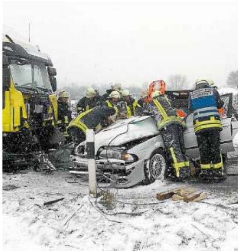
Lebensgefährliche Verletzungen erlitt ein Pkw-Fahrer bei diesem Unfall auf der Landesstraße 811.