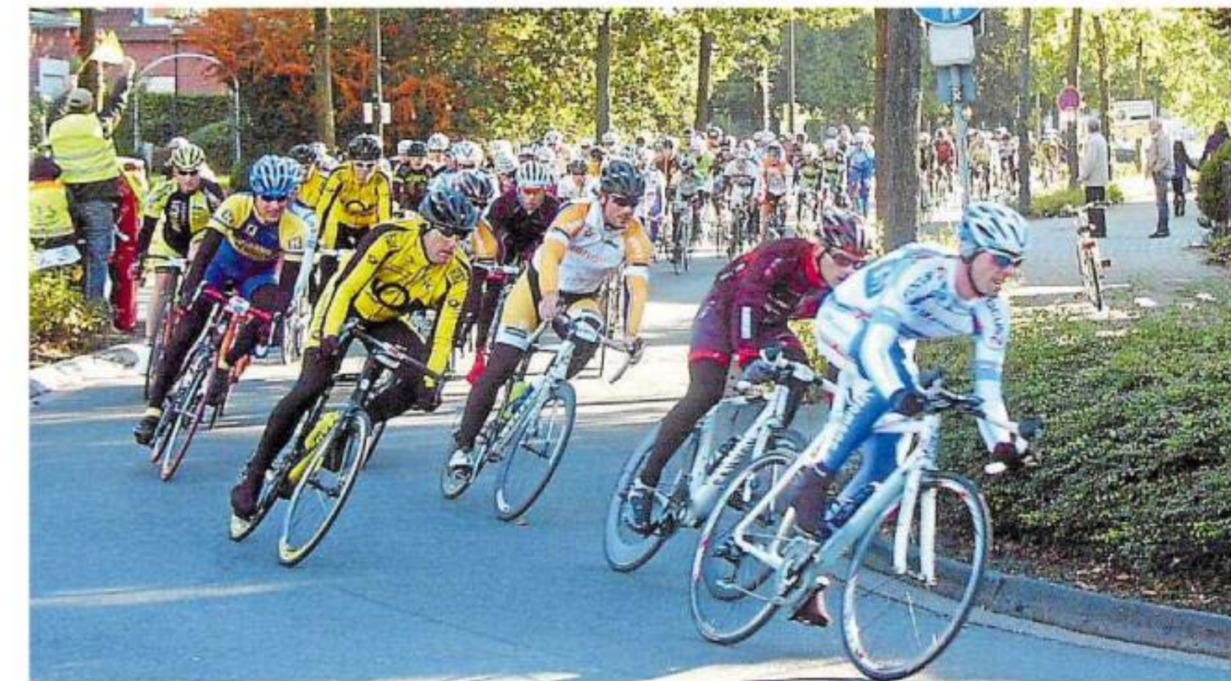
Das Hauptfeld hatte die fünfköpfige Spitzengruppe bereits in Westbevern aus den Augen verloren. Dort erwartete aber alle Radfahrer eine tolle Fanmeile mit viel Stimmung.

Der Krink, der Bürgerschützenverein Westbevern-Dorf, der Schützenverein Westbevern-Vadруп, der SV Ems Westbevern und der Förderverein der Grundschule hatten die Organisationsleitung der Fanmeile Westbevern inne und sorgten für ein abwechslungs-