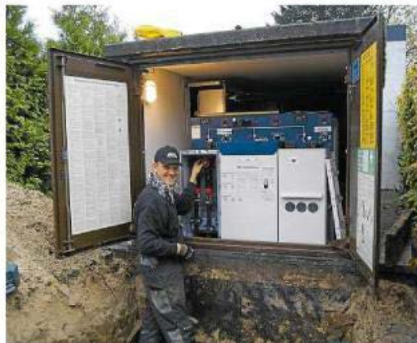
Rund eine halbe Stunde blieben am späten Mittwochabend Telgte und Westbevern ohne Strom. Mit ursächlich für den Ausfall war neben einem Kabelfehler die Trafostation an der Daimlerstraße, die gestern repariert wurde.