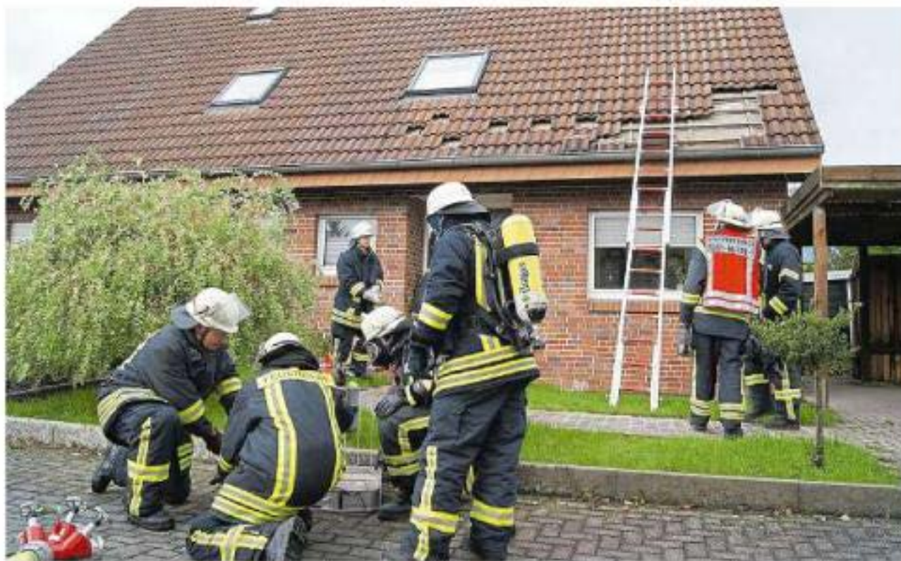
Aufgrund der Beobachtungen von Nachbarn ging die Feuerwehr von einem Dachstuhlbrand aus.

Da die Bewohner zum Zeitpunkt des Einsatzes nicht zu Hause waren, erkundete die Feuerwehr die Lage zuerst von außen. Dabei sei den Ehrenamtlichen aufgefallen, dass die Haustür im oberen Bereich ausgesprochen warm gewesen sei. Daher entschied sich die Feuerwehr – die Polizei war ebenfalls vor Ort – aufgrund