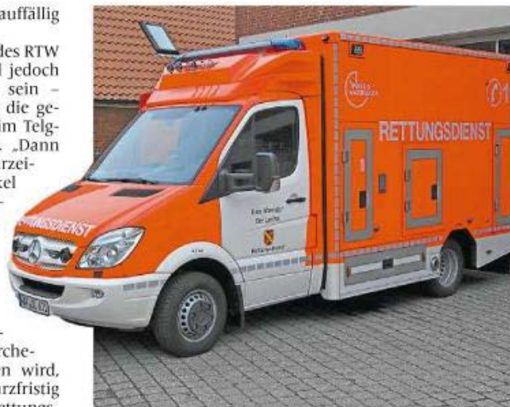
Der zweite Rettungswagen , der seit einiger Zeit in Telgte stand, wird tagsüber vorübergehend in Alverskirchen stationiert, um die Versorgung in Everswinkel zu verbessern.

„Da sich der Neubau an der Alverskirchener Straße hinziehen wird, wollen wir jetzt kurzfristig für eine bessere rettungsdienstliche Versorgung Everswinkels sorgen“, so Landrat Dr. Olaf Gericke.