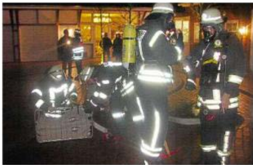
Zwei Vermisste suchten die Mitglieder des Löschzuges Westbevern bei einer Übung auf dem Hof Wassermann.

Als die Feuerwehrleute mit zwei Fahrzeugen am Übungsort eintrafen, quol-