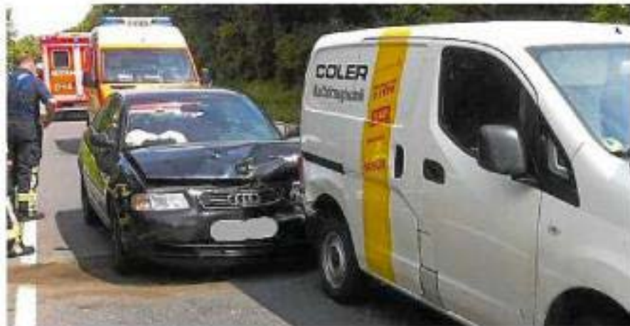
Zu einem Auffahrunfall kam es am Mittwochmittag auf der B 51.

-agh- TELGTE. Zwei Personen wurden am Mittwochmittag bei einem Auffahrunfall auf der B 51 leicht verletzt. Ein 22-jähriger Lippstädter fuhr mit seinem Pkw der Marke Audi in Fahrtrichtung Münster und bemerkte nach Polizeiangaben zu spät, dass ein Kleintransporter vor ihm wegen eines Rückstaus in Höhe der Gärtnerei angehalten hatte. Er fuhr auf.