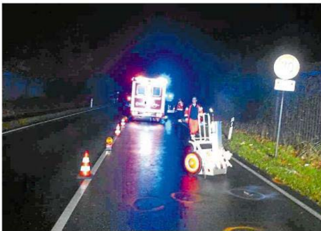
Tödlich verletzt wurde ein Telgter am Donnerstagmorgen bei einem Unfall auf der Umgehungsstraße in Höhe Klatenbergweg.