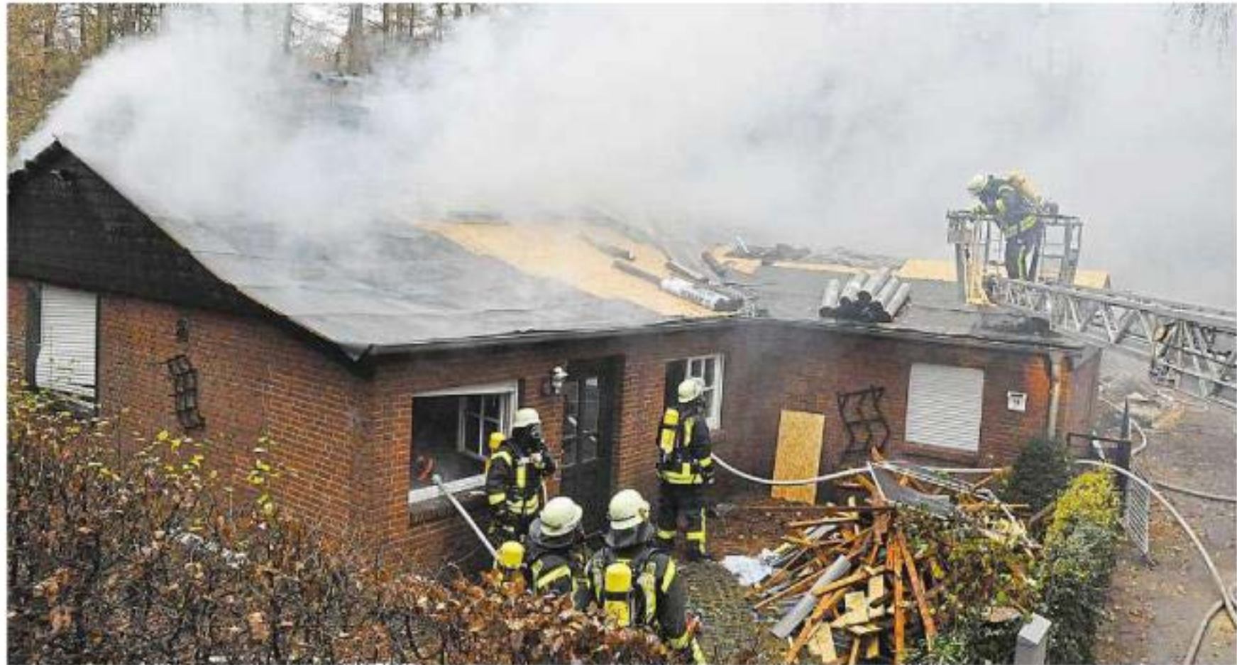
Möglicherweise Dachdeckerarbeiten sind die Ursache für einen Brand am Donnerstagmorgen in der Vadruper Bauerschaft Sickerhook. Dieses Haus wurde dabei komplett zerstört.

Trotz eines Löschangriffs von mehreren Seiten und des Einsatzes zahlreicher Atemschutzträger dauerte es längere Zeit, bis der Brand eingedämmt werden konnte. Immer wieder kamen Flam-